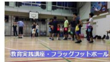
教育実践講座・フラッグフットボール