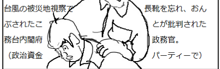
台風の被災地視察でぶされた公務内閣府(政治資金) 長靴を忘れ、おんが批判された政務官。(パーティーで)