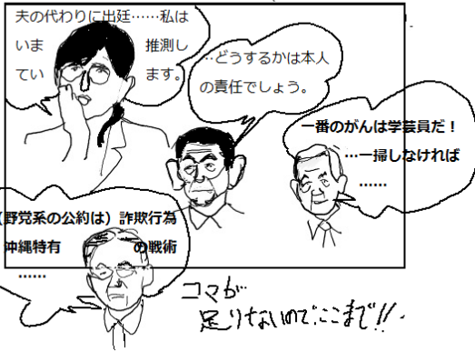
夫の代わりに出延……私はいま推測して、どうするかは本人の責任でしょう。一番のがんは学芸員だ! ……一掃しなければ…… (野党系の公約は) 詐欺行為 中絶特有の戦術 コマカ 足りないわけにない!!