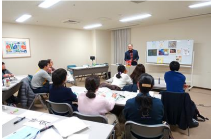
参加者の感想から

☆アニメーションがこんなに楽しいことを初めて知りました。ぜひ、クラスでやってみたいと思いました。特に絵本の一場面をたくさん集めてクイズにしたものは、その本を読みたくなる効果がすごいと感じました。子どもたちに本を読みたいと思わせるしかけを作ってあげたいと思いました。