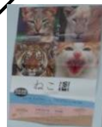
会場に貼っただったポスター